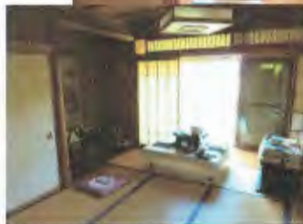
現況と相違する場合には現況を優先